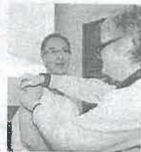
Vaccinazione in pubblico