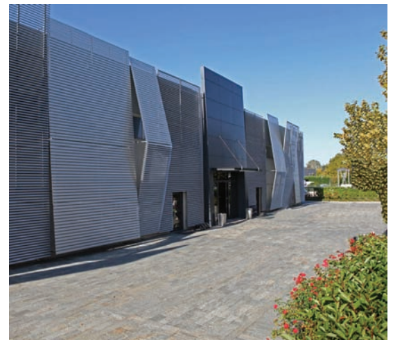
Lo Studio Radiologico Centocannoni, ad Alessandria

innovazione tecnologica in questo settore, Philips Ingenia è espandibile per le future possibilità cliniche. Possiamo quindi sostenere che questa è una macchina che può godere di una vita più lunga perché è sempre aggiornabile. Per il Centocannoni si tratta di un vero investimento che dura nel tempo. Presso il centro diagnostico del Basso Piemonte, non si deve ritornare in un secondo momento per ritirare il referto di un esame di imaging: l'esito viene consegnato nell'immediato e non si perde tempo. Tutto il lavoro è organizzato per facilitare e alleggerire il carico anche psicologico di chi si sottopone agli esami.