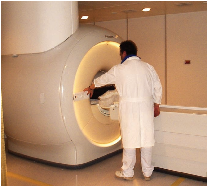
Philips Ingenia 1,5T, la nuova RM del centro diagnostico

P resso lo Studio Radiologico Centocannoni di Alessandria è allestita la Risonanza magnetica Philips Ingenia 1,5T. Si tratta di un grande passo tecnologico per migliorare la qualità dei servizi a disposizione dei pazienti e per conservare l'eccellenza nella diagnostica radiologica. In un momento di crisi come quello che stiamo vivendo da qualche anno e che coinvolge anche il settore della sanità, una scelta di questo tipo è anche un forte impegno dal punto di vista economico, un segnale importante che fa capire che per Alliance Medical – il gruppo di cui fa parte anche il Centocannoni – in primo piano è sempre il bene del paziente.