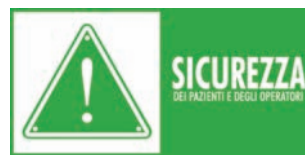
Corso SICUREZZA DEI PAZIENTI