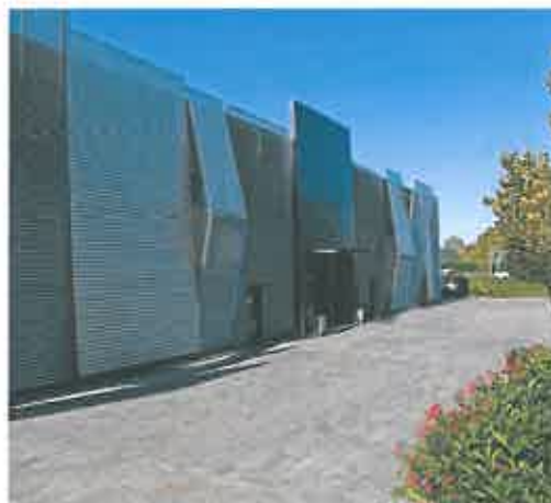
Lo Studio Radiologico Centocannoni, ad Alessandria

Bisogna ricordare a noi stessi e ai pazienti che ci sono degli esami che salvano davvero la vita. Presso lo Studio Radiologico Centocannoni , si possono effettuare TC del torace a bassa dose in convenzione con il Servizio Sanitario Nazionale, oppure – ad un costo di 70 euro – in regime di libera professione.