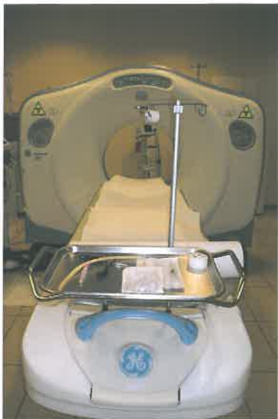
TAC GE Light Speed

Oggi il tema più importante della salute è l'anticipazione diagnostica che utilizza l' imaging come prezioso alleato nei controlli di routine e non solo per tenere sotto controllo una patologia conclamata.